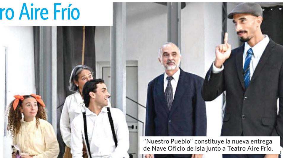
“Nuestro Pueblo” constituye la nueva entrega de Nave Oficio de Isla junto a Teatro Aire Frío.

¿El vestuario y los atrezos? Sobrios, sencillos, lo necesario para ambientar la época y el espacio. En este, como en todos los pueblos, las personas y sus historias son lo más importante. Sobre la familia, la juventud, las bodas y el matrimonio, los sueños y el amor nos cuentan sus protagonistas.