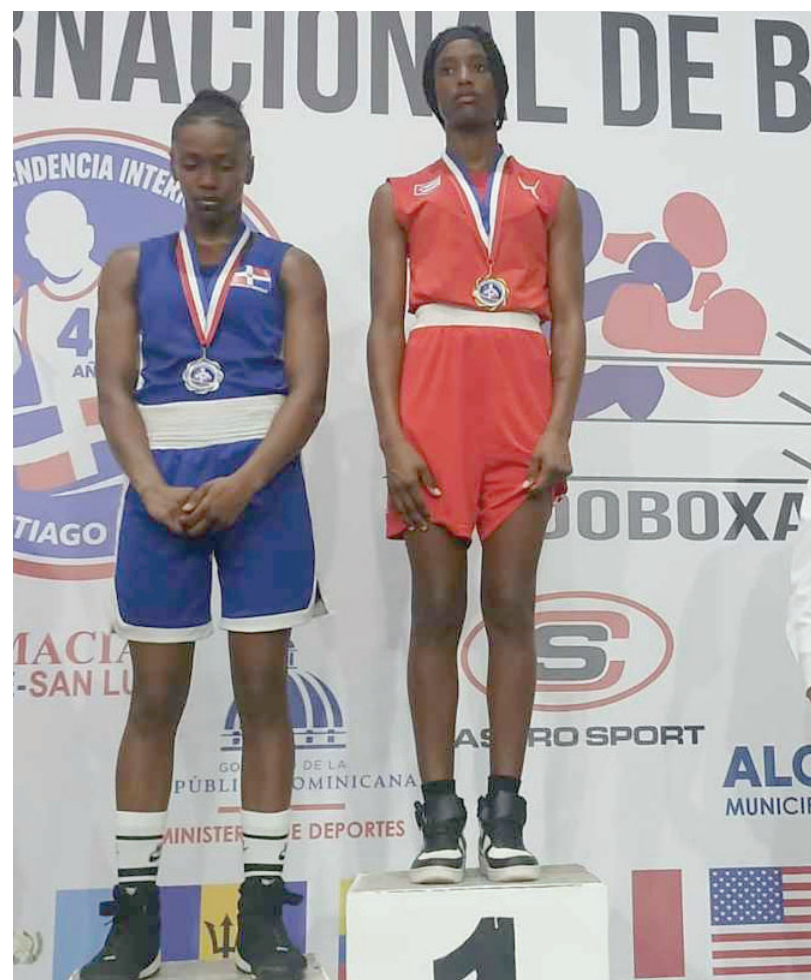
La pugilista capitalina ya ha mostrado su talento en eventos internacionales.

No obstante, su actual buen estado físico, el riguroso entrenamiento y la confianza que desde lo psicológico le han generado sus títulos –primero el conseguido en Santiago de los Caballeros y ahora el conquistado en Rostock– pudieran coadyuvar a lograr la revancha ante la representante de Venezuela en el combate definitorio y, de paso, asegurar una presea dorada para el boxeo femenino cubano, con la cual mejoraría en el medallero el 0-1-2 alcanzado en San Salvador 2023.