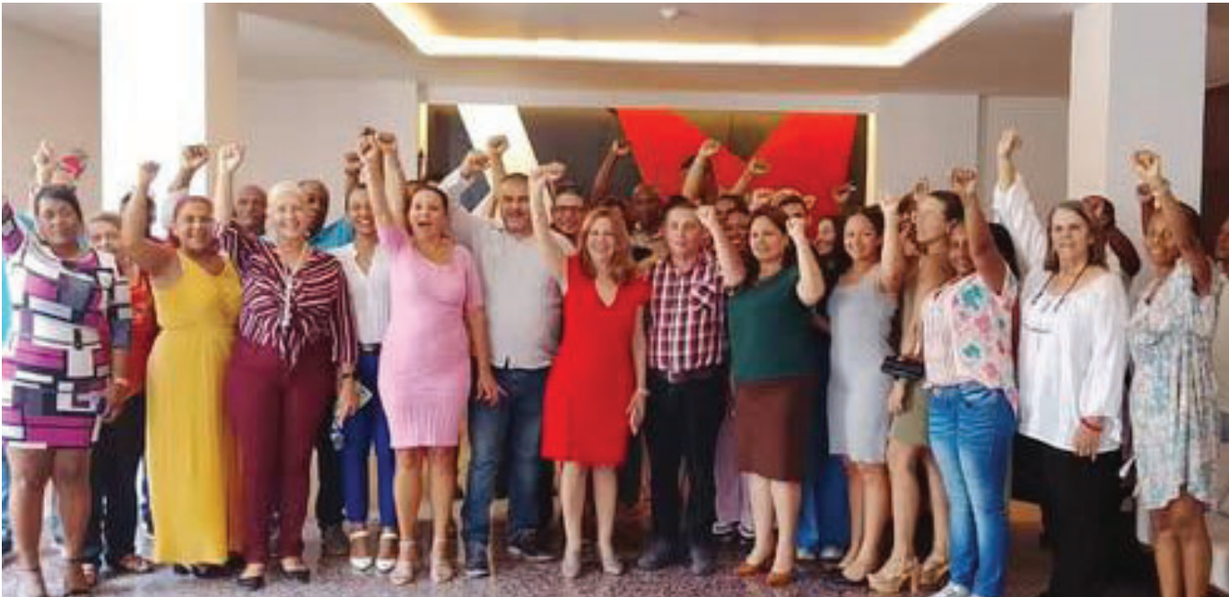
Los trabajadores del MINJUS condenaron enérgicamente la reciente acusación infame del Departamento de Justicia de Estados Unidos contra el General de Ejército Raúl Castro Ruz, líder de la Revolución Cubana.