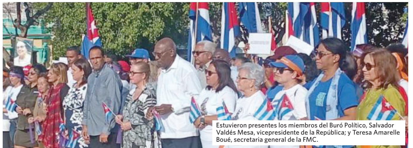
Estuvieron presentes los miembros del Buró Político, Salvador Valdés Mesa, vicepresidente de la República; y Teresa Amarelle Boué, secretaria general de la FMC.