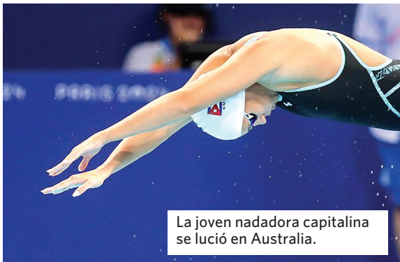
La joven nadadora capitalina se lució en Australia.

POR: JUAN CARLOS TEUMA DÍA