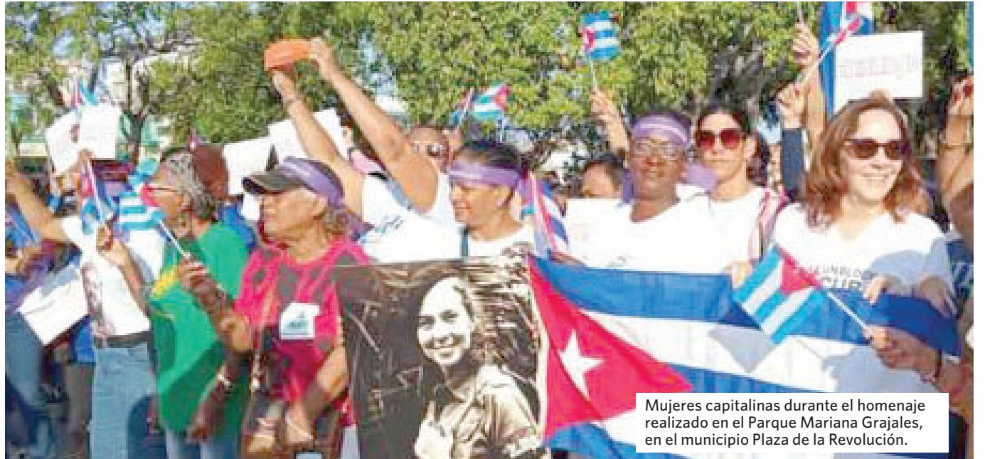
Mujeres capitalinas durante el homenaje realizado en el Parque Mariana Grajales, en el municipio Plaza de la Revolución.

En las palabras centrales, la Secretaria General de la FMC reafirmó el compromiso de la mujer cubana con la Patria y la Revolución, y destacó la firme convicción de ser dignas continuadoras de la herencia mambisa y rebelde de la mujer cubana. La dirigente femenina exigió el fin de la política genocida y de las amenazas de agresión por parte de Estados Unidos contra el pueblo de Cuba.