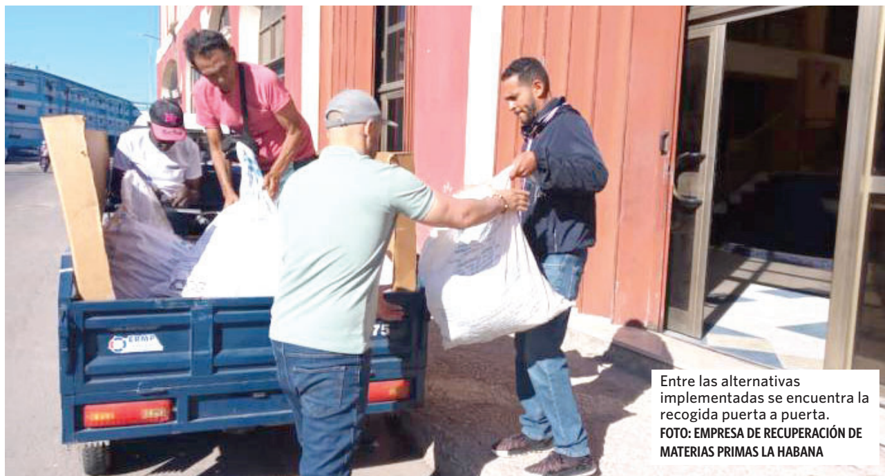
Entre las alternativas implementadas se encuentra la recogida puerta a puerta.