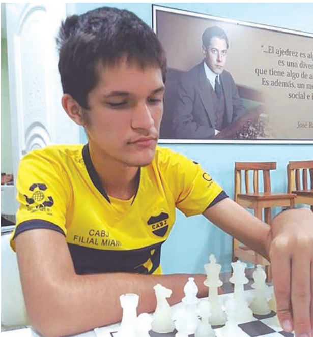
El joven ajedrecista capitalino ya ha subido a lo más alto del podio en lides nacionales e internacionales.

POR: JUAN CARLOS TEUMA DÍAZ