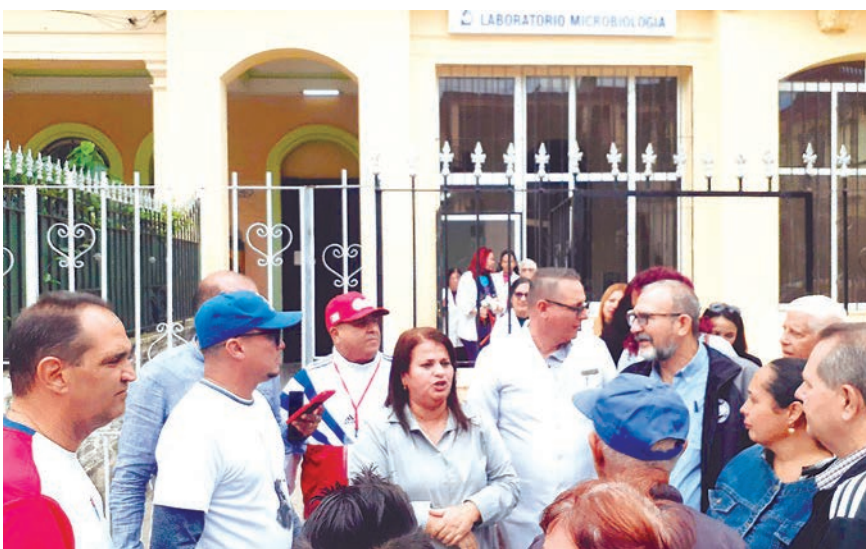
La Gobernadora de La Habana, enfatizó la importancia de la contribución territorial para alcanzar los resultados del Hospital González Coro. Vista exterior del Laboratorio Central de Microbiología.