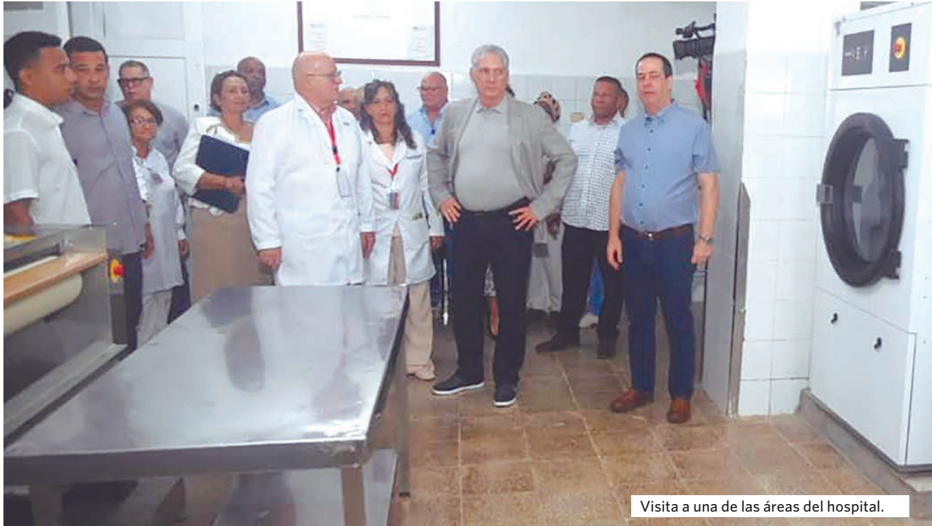
Visita a una de las áreas del hospital.

Durante su visita al Hospital Ortopédico Docente -y con otras precedentes a instituciones que viven también procesos de transformación tecnológica-, el Primer Secretario del Comité Central y Presidente de la República, Miguel Díaz-Canel Bermúdez, subrayó que “nos vamos dando cuenta de que tenemos un ecosistema de transformación digital, y ya con aplicación de Inteligencia Artificial, que casi nos va dando toda una carpeta, una plataforma para extenderla al servicio primario, secundario y terciario del Sistema de Salud Pública.