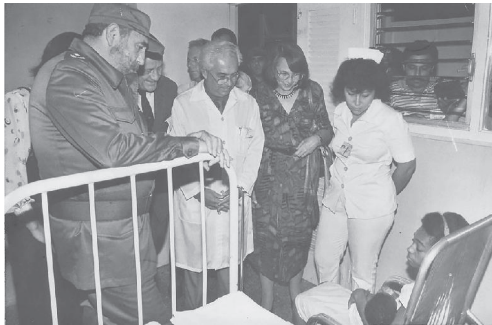
En el Hospital Pediátrico Juan Manuel Márquez, del municipio de Marianao.