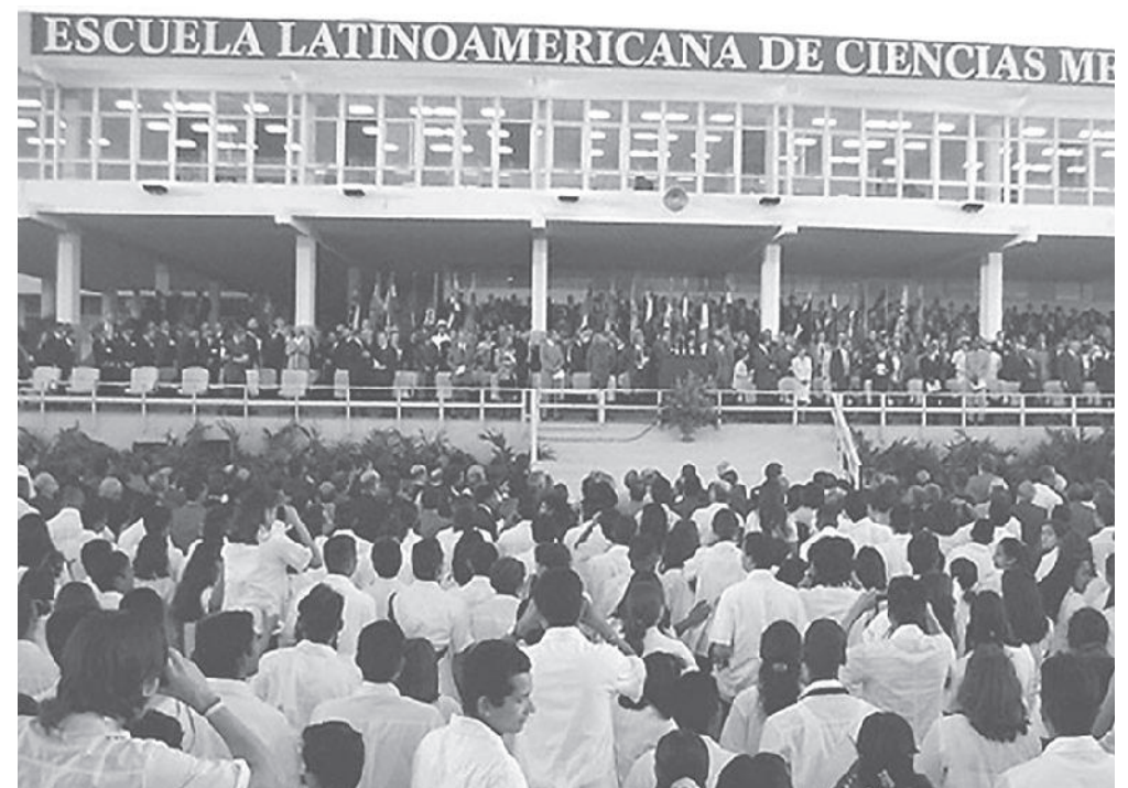
Inauguración de la Elam.

YOEL RODRÍGUEZ TEJEDA