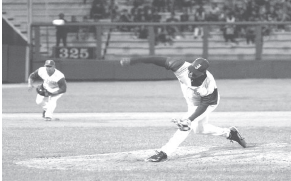
Mejorar la ofensiva y la labor de los lanzadores es imprescindible para que los azules retomen el camino del éxito.

to cambio experimentado por Industriales : en la primera fase fueron líderes en average ofensivo (321) y ahora exhiben el peor entre los seis concursantes (222), en el segmento inicial comandaron el slugging (467) y en estos momentos son penúltimos (296), antes promediaban 2,95 extrabases por partido y actualmente solo producen 1,27 por cada pleito, al finalizar la primera etapa su porcentaje de embasado (OBP) era el mejor del campeonato (404) y hoy por hoy es el más bajo (281).