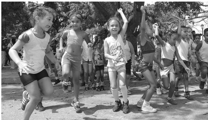
Niños habaneros participan de juegos tradicionales en el parque La Normal.

Los pequeños amantes del séptimo arte podrán llegar al Cine 23 y 12, los días 18 y 19, para ver la