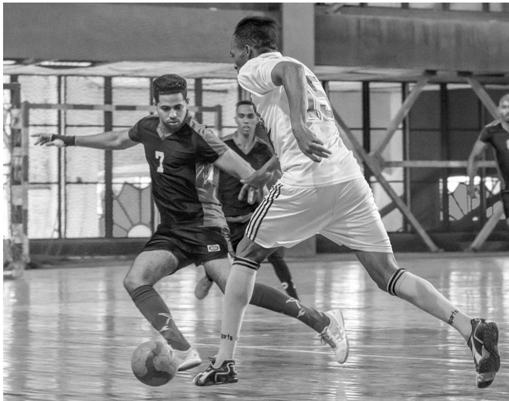
La emoción del gol solo llegó dos veces en el partido decisivo.

Justo antes del desafío final, el conjunto de Diez de Octubre superó a su similar de