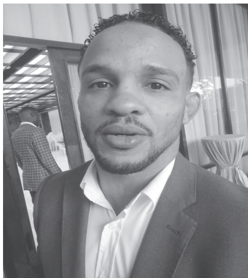
TEXTO Y FOTO: OSCAR ÁLVAREZ DELGADO

En Cuba, los deportes de combate, cuentan con una gran fuerza. Si bien el boxeo es el buque insignia de las armadas del patio a los eventos múltiples, disciplinas como el judo y la lucha, gracias a la calidad de sus practicantes, son responsables de un gran número de preseas en esos certámenes. De ahí, que varios miembros de ellas hayan sido galardonados entre los mejores deportistas del país en 2017.