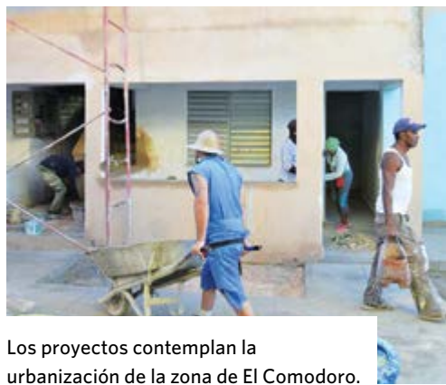
Los proyectos contemplan la urbanización de la zona de El Comodoro.