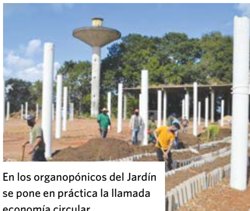
En los organopónicos del Jardín se pone en práctica la llamada economía circular.

La Empresa Contingente de la Construcción Blas Roca, de la capital, edifica o transforma 198 viviendas en la Comunidad de Tránsito La Fraternidad, ejecutadas con el sistema del tipo Sandino, el cual garantiza ganar en agilidad en las operaciones y facilita el ahorro de acero y recursos. Una de las naves de los albergues será aprovechada para crear centros de servicios: bodega, consultorio médico, farmacia, mercado.